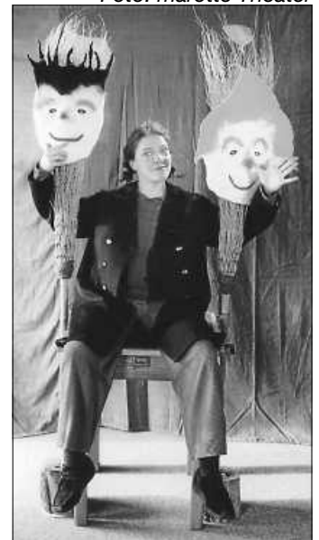
„Max und Moritz“